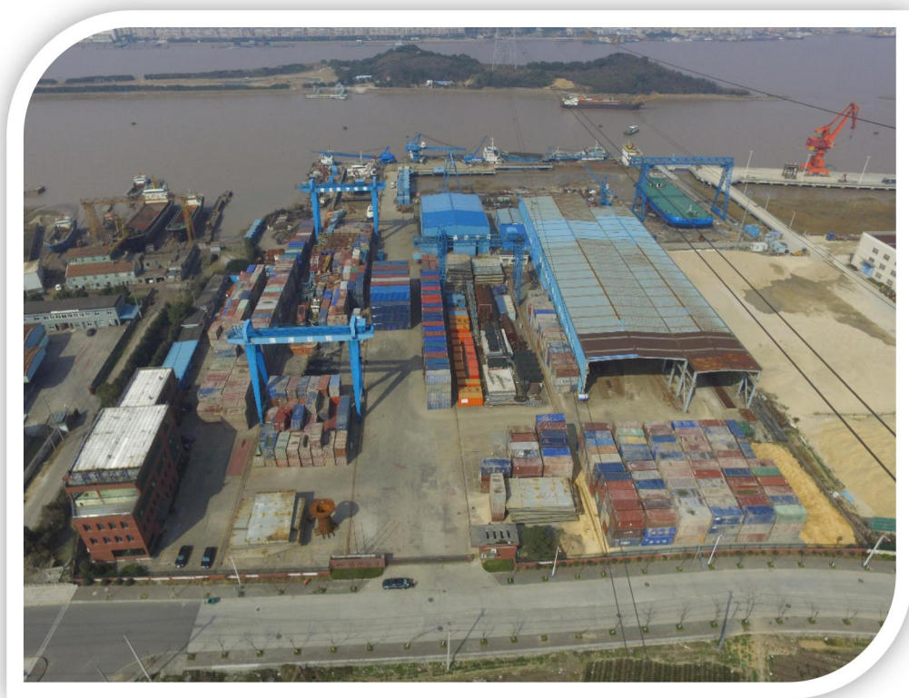
图 4 集装箱堆放在公司场地的全景图

本次抢险,我公司除设立抢险作业指挥部外,还设有潜水组、清污组、码头集装箱装卸组等辅助力量。现场指挥部作为抢险作业的核心,是整个抢险现场的灵魂,但是抢险最终取得成功,更离不开这些辅助力量的密切配合。比如码头集装箱装卸组,对于集装箱船抢险来说,就起到了无可替代的作用。“鸿源 02”虽为小型集装箱船,所载集装箱不过 900 多个,但对于非专业堆场来说,如何快速的卸载运抵码头的集装箱并合理的堆放也是一个棘手的问题。如果配套力量速度跟不上,就会拖了抢险现场的后腿;另外集装箱船的货主往往有数家甚至数十家之多,如果对集装箱的堆放不合理,就会对后期货物利益方的验损和提货产生较大的影响,增加不必要的翻箱倒箱费用。单从本次案例来看,出动的码头集装箱装卸组人次就达到 4508 人次,占据全部人次的 34%,因此对于本次抢险涑水,辅助力量——堆场指挥部所起到的关键作用完全不亚于现场指挥部。除此之外,潜水组、清污组等也起到了关键的作用。