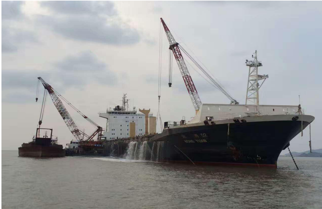
图3 “鸿源 02” 轮起浮后现场照片