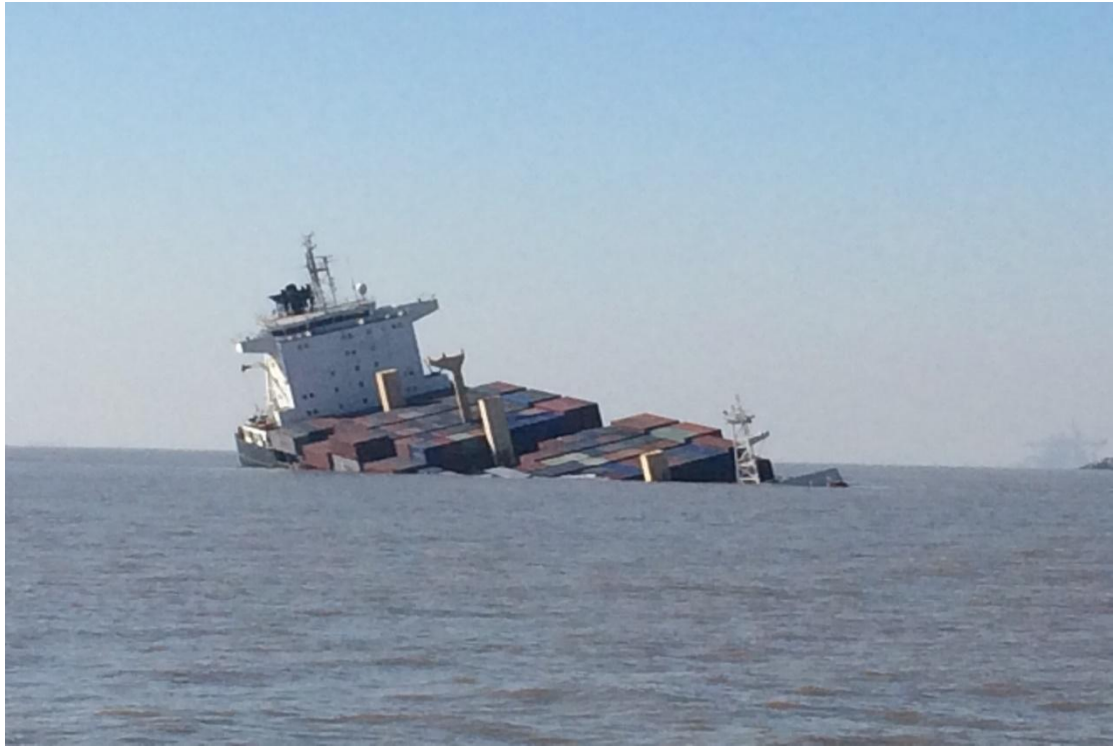
图 2 难船沉没概况 2